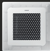
Wind-Free™ 4-cestná kazetová jednotka