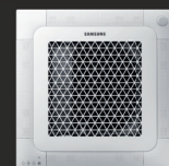
Wind-Free™ 4-cestná mini kazetová